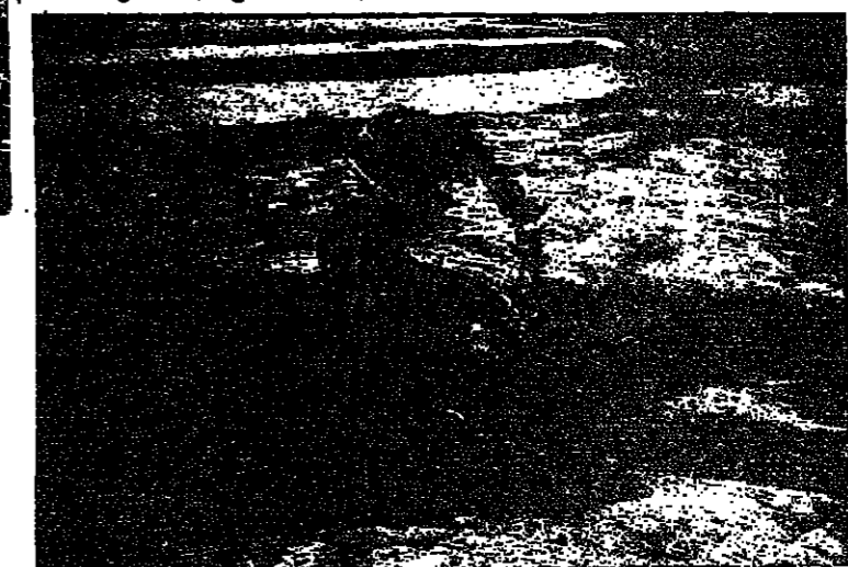
مايكو يصحح توازنه

وهذا ظهر جليا عندما اخذ اقتراني يتحلقتون على المتعطفات لشدة سرعتهم وتهورهم . وقبل خبسي لثبات من انتهاء السباق ، ظهر لي المراكز المتقدمة كل من غابون على الكواسكي ، وموزير على ياماها . وقد اخذ هذان الدرارجان يتناحسان بجون ويجتازان القامس ظهر الاخر ، الى ان اضطر الى دخول منعطف الذي اليمين اضحي موحلا لكثرة ما مرت عليه المعجلات . ويلطبع فلم يملك اي منهما مقدرة والزلت «الياماها» على عجلتها واصططحت يمحرك الكواسكي التي حاول سائقها السيطرة على الموقف ولكن دون جدوى ، اذ ان العجلة الالمانية انزلت